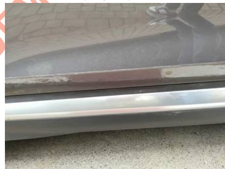
Porte avant gauche (Rayure)